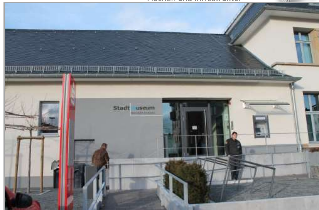
Empfangshalle nach der Sanierung: Stadtmuseum