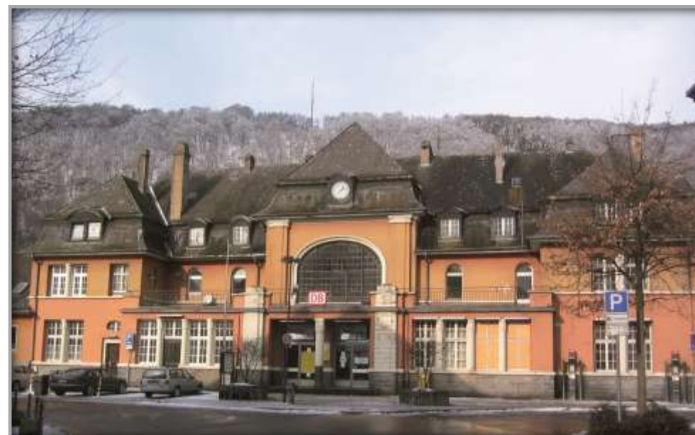
Außenansicht vor der Sanierung und Entwicklung

Die bereits durch die BEG erstellten Sanierungs- und Umbaukonzepte konkretisierte die Stadtverwaltung nach dem Verkauf. Heute befinden sich im Empfangsgebäude Stadtarchiv- und Museum sowie ein Kulturforum, die Kunstwerkstatt KUBA, eine Tourist-Information sowie eine Bäckerei mit Gastronomiebereich. Außerdem hat die Wohnungsgesellschaft Werdohl ihre Geschäftsstelle und Verwaltung in das sanierte Empfangsgebäude verlagert. Des Weiteren sind ein Zentraler Omnibus-Bahnhof und eine Park & Ride-Anlage in Planung.