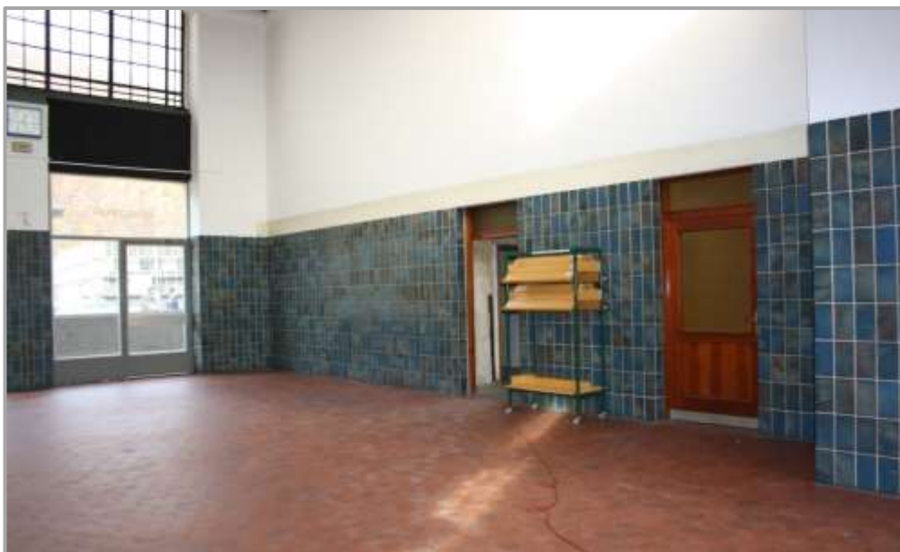
Empfangshalle vor der Sanierung