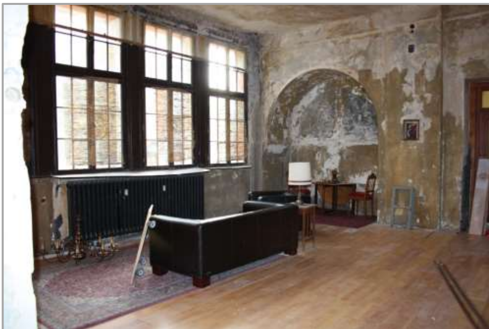
Empfangshalle vor der Sanierung