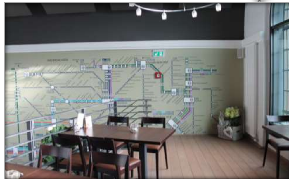
Gastronomiebereich nach der Sanierung und Entwicklung