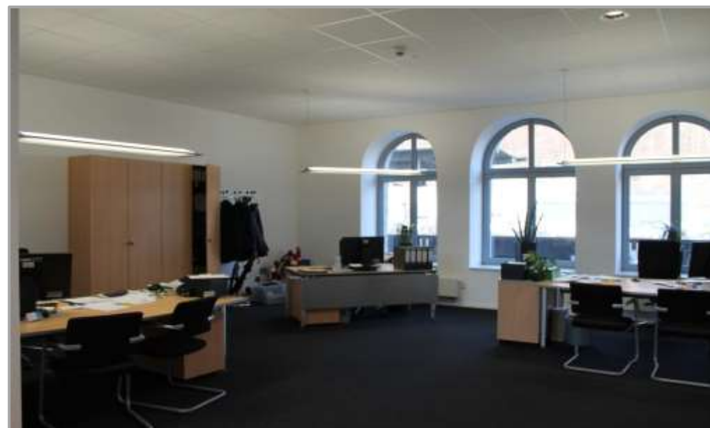
Empfangshalle nach der Sanierung: Geschäftsstelle Wohnungsgesellschaft Werdohl