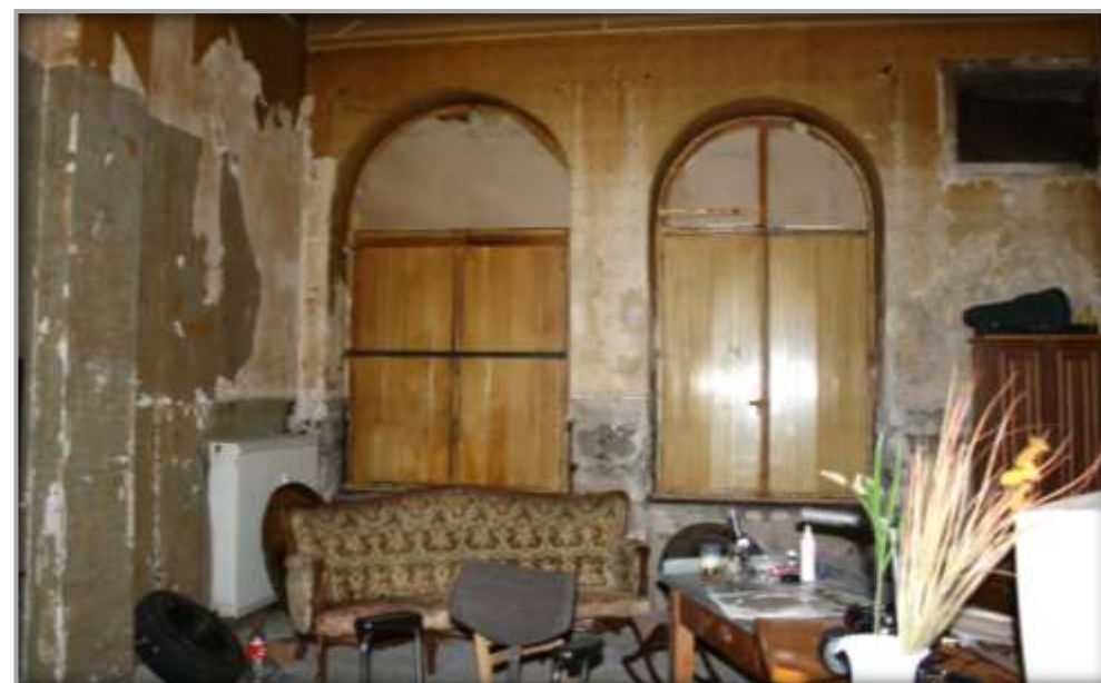
Gastronomiebereich vor der Sanierung und Entwicklung