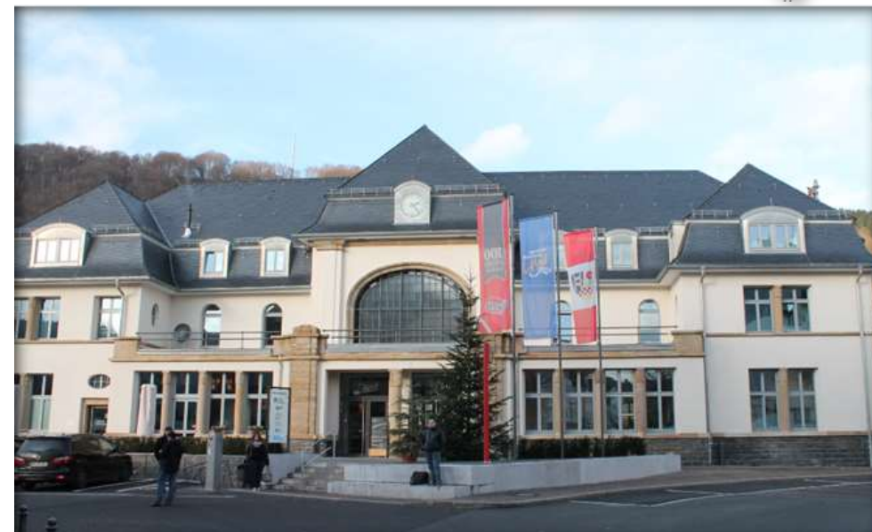
Außenansicht nach der Sanierung und Entwicklung

Das stadtbildprägende Empfangsgebäude wurde 2008 durch die Stadt Werdohl mit Hilfe einer Stiftung der Firma Vossloh erworben.